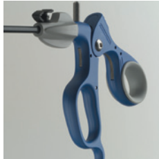
Klick Spitze und Griff kuppeln