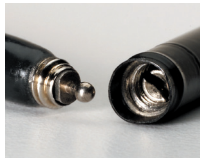
Klick-Fit Mechanismus für einfache Montage