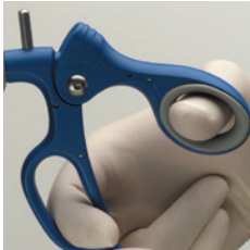
Spreizen Griff öffnen