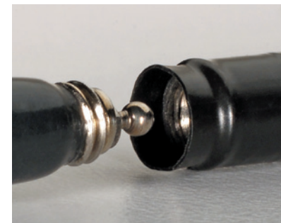
Erweiterte Isolierung , um jeglicher Freilegung von leitfähigen Metalloberflächen vorzubeugen

Für weitere Informationen oder wenn Sie eine Bestellung platzieren möchten, kontaktieren Sie bitte Ihren V.Mueller®/Snowden-Pencer® Händler oder besuchen Sie carefusion.com/thinkblue .